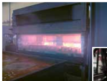
Vår härdugn och kylbassäng

Till skillnad från produkter framtagna ur färdighärdad plåt, skärs och bearbetas FBs X3M-produkter till färdig form innan härdning. Detta medför rätt hårdhet på detaljens alla ytor som annars tappar härdning efter skärning (anlöpning). Produkter ur FBs X3M-serie anpassas i hårdhet och seghet för att uppnå bästa möjliga resultat med avseende på LCC.